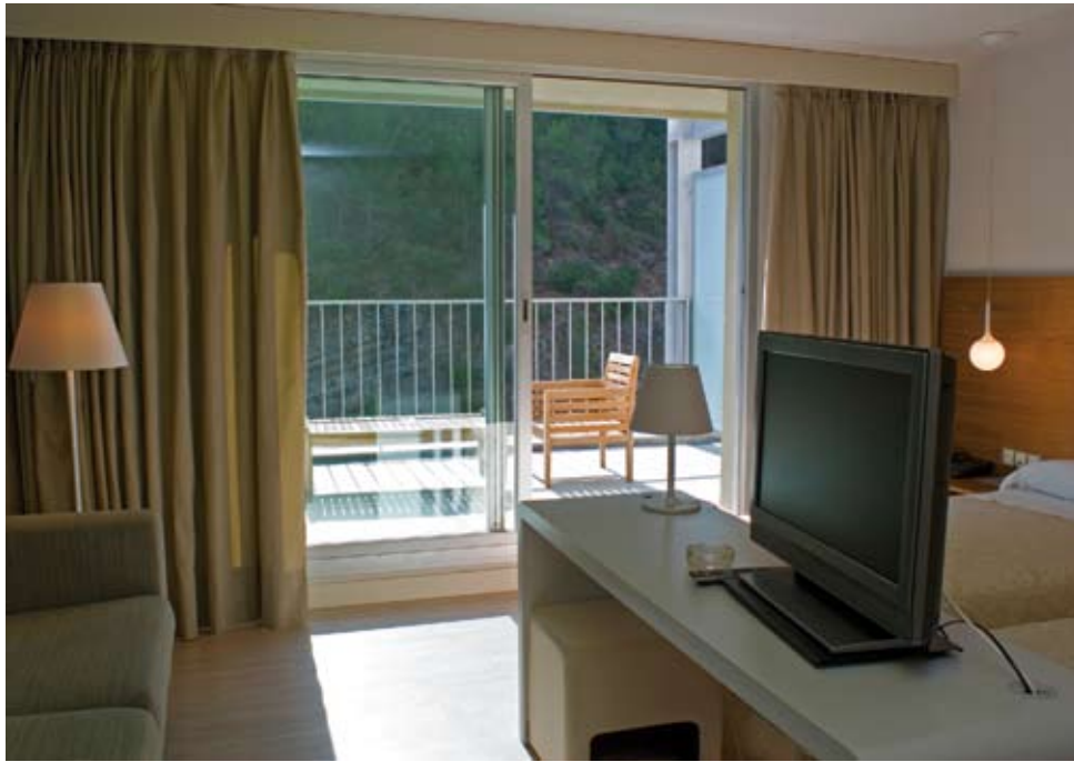
Habitación Doble Superior con Terraza