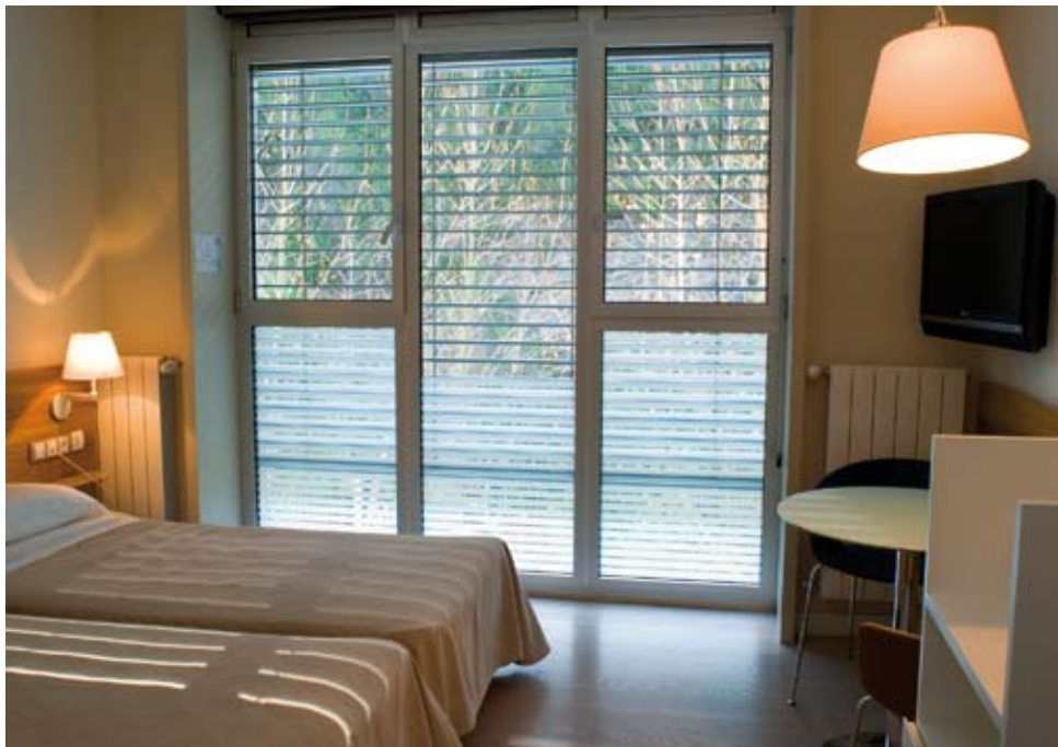
Habitación Doble Superior